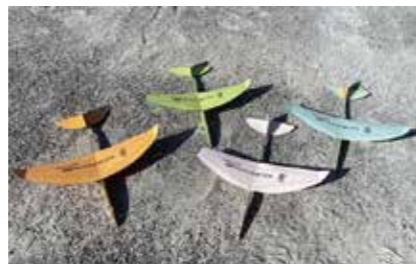
左が優勝した飛行機。長く飛びます！