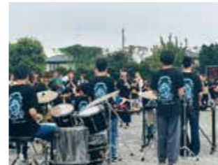
鴨中吹奏楽部による演奏