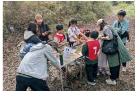
美と芸術のイタリア国のお題は絵を描くこと