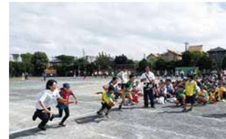
子どもから大人まで襷を継いだ「全員リレー」