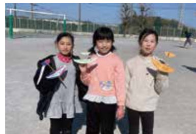
自分で作った思い入れのある飛行機