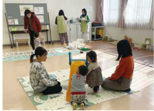
寒くても、雨でも集まることができて大好評！

たちばな台町内会館内に昨年4月より、オープンした『ふらっとラフールたちばな台』は、0歳から未就学児とその家族（養育者）・妊婦とその家族が利用できるひろばです。毎週金曜日午前10時から午後3時までオープンしています。地域の子育て家族がつながり、交流しています。登録・利用は無料で、保育士による子育て相談日もあります。