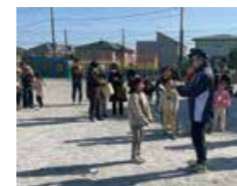
子どもの部優勝の表彰