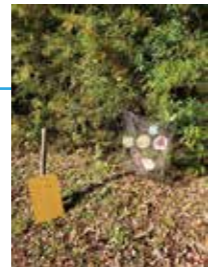
ケニア国のミニ槍投げ。竹串を投げて的に刺すゲーム