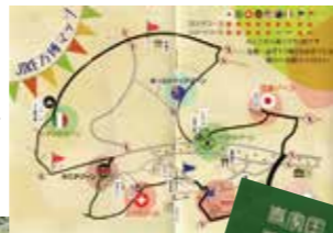
寺家国地図とパスポート