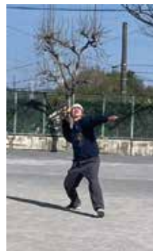
大人の部・優勝の飛行

規定の紙ひこうきを自分で作って滞空時間を競います。より長く飛ばせるように、作成するときに工夫して、風を味方に飛ばします。子どもも大人も楽しめる大会になりました。今年度から紙飛行機用紙は無料配布になったので、昨年の倍近くの参加がありました。