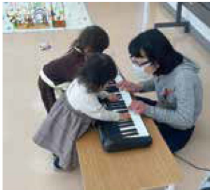
ボランティアの方が弾いてくださるキーボードに興味津々