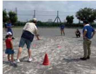
狙った数字の棒(スキットル)を倒すのはなかなか難しいモルック

4人で1チームを組み、3つの競技を順番に回りました。友だち同士(子ども)や親子、ご近所同士(大人)などで参加されていました。