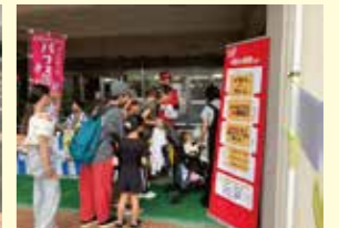
キッチンカー 飲食販売コーナー