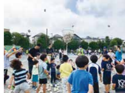
100個近く入った「子どもの玉入れ」