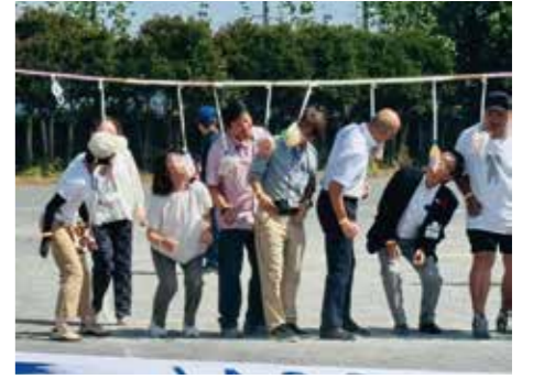
青葉区長や校長先生も参加した「パン食い競争」