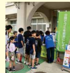
環境推進委員会による ゴミ分別クイズ