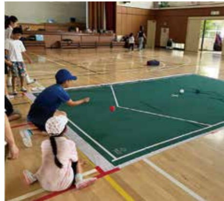
鴨一小の校長先生も参加！