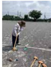
グラウンドゴルフに挑戦

ポッチャ、モルックは2チームで対決。いつの間にか子どもも大人も真剣に！あちこちで歓声が上がりました。