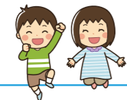
パビリオンでは仮装したスタッフがお出迎え

今年のテーマはJIKE万博！25組約80名が参加。寺家ふるさと村に設営された7つの国のパビリオンを回ります。どのパビリオンから回ってもOK。受付で寺家国パスポートを受け取り、似顔絵を描いたらスタート。パビリオンでは各国ならではのゲームやクイズをして、キーワードをゲット。全員時間内に戻ることができました！