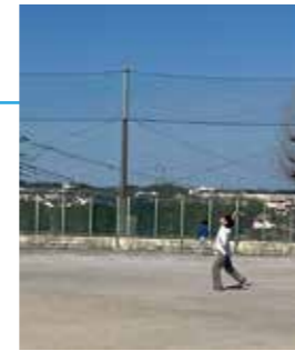
風を味方につけて