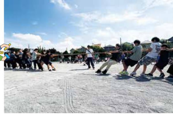
熱い戦いを繰り広げた「大人の綱引き」

今年のスポーツフェスティバルは晴天に恵まれ、多くの方々にご参加いただきました。盛り上がったのは「大人の綱引き」。賞品(スターバックスカード)を賭け、参加者の皆さんは力いっぱい競技に臨んでいました。子ども達も大声援で大いに盛り上げてくれました。今年初の試み・年齢制限撤廃「全員リレー」では、子どもから大人まで一人ひとりが頑張ってバトンをつなぎ、この地域の良さを感じられる競技となりました。