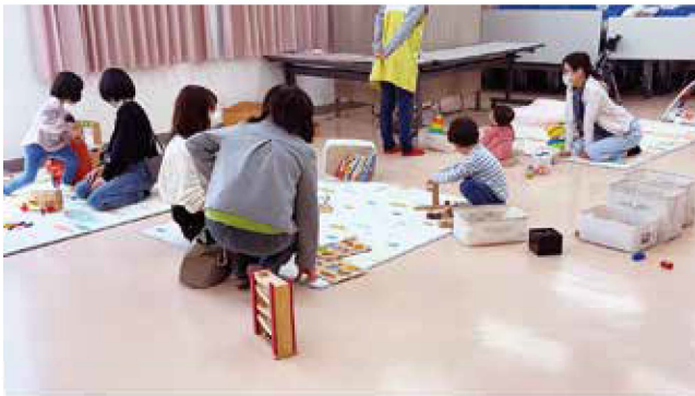
町内会長さん、お母さん達、ラフールスタッフみんなで子どもたちを見守っています