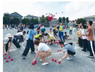
大人も童心に返って「玉入れ」を楽しみました

ピロティでは、STORK BREAD、つくしんぼ食堂、ウチルカ、でんぱた、とうりによる飲食販売のほか、環境推進委員会や廣田新聞によるゲームコーナーが出店されました。また、地域の方々によるフリーマーケットやワークショップ、ベトナム料理のキッチンカーも来て、多くの子ども達が競技の合間に楽しむ姿が見られました。